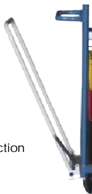
option timon de traction 882006608