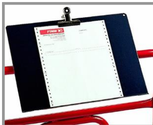
802000010 Porte document A3 couché