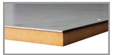
Plateau tôle en acier zingué