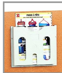
802000001 Porte document