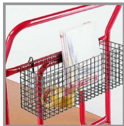
802000002 Panier à fil