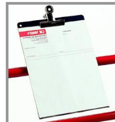
802000012 Porte document A4 debout

Notre gamme de chariots se compose de 248 références