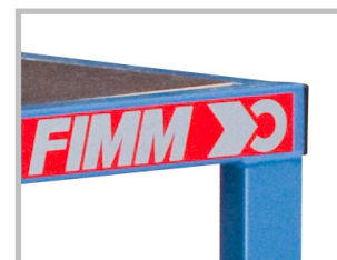
Plateau bois GLISSNOT épaisseur 16 mm